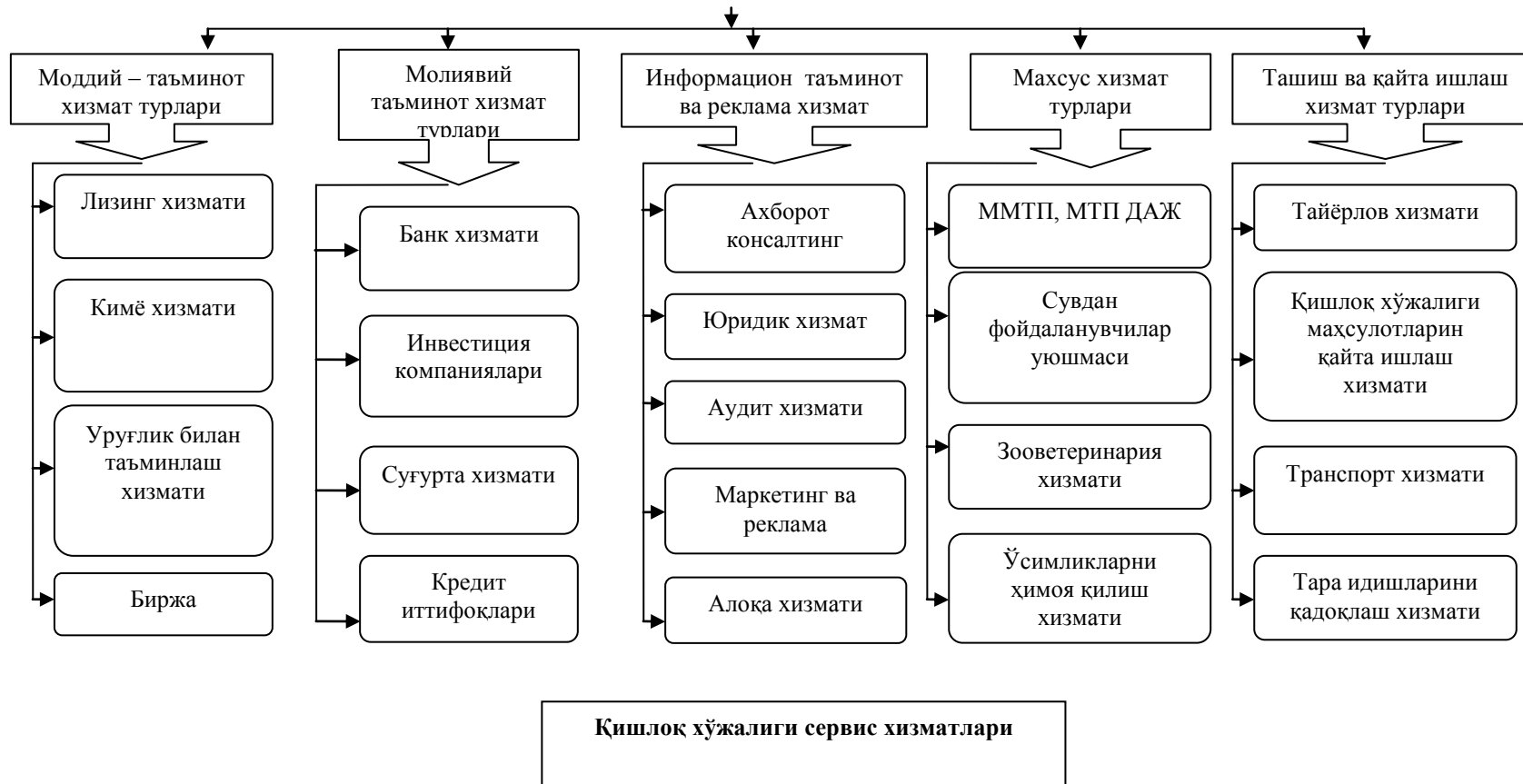
1.1.1 – расм. Қишлоқ хўжалигида сервис хизмати кўрсатиш тизими таснифи