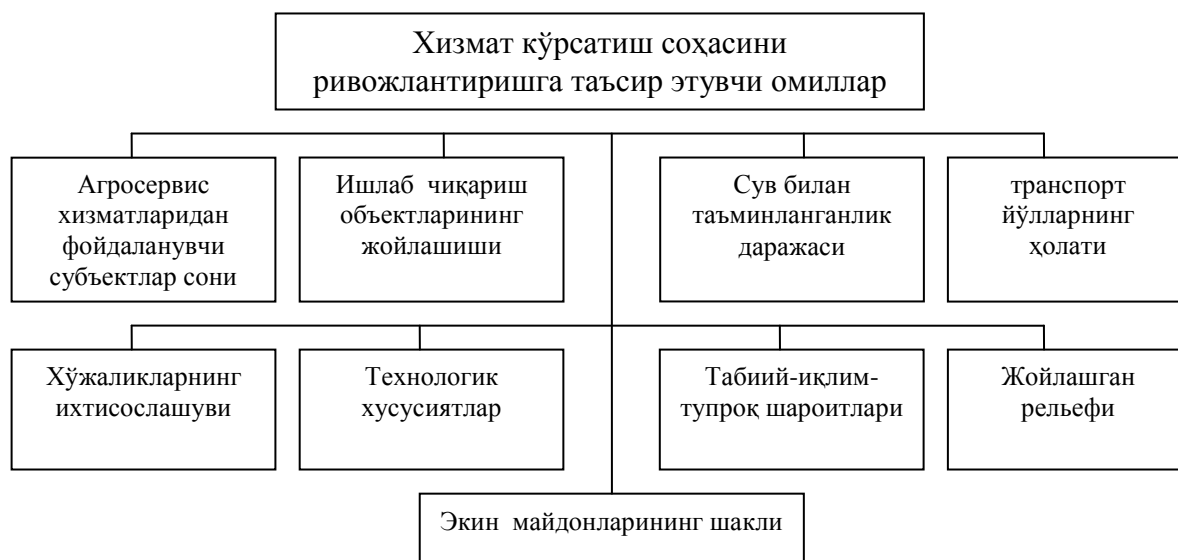
1.2.1 – расм. Қишлоқ хўжалигида хизмат кўрсатиш соҳасини ривожлантиришга таъсир этувчи омиллар тизими..

Бундан ташқари, қишлоқ хўжалигида хизмат кўрсатиш соҳасини шакллантириш ва ривожлантиришга бир қатор омиллар ҳам таъсир этади (1.1-расм).